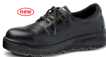
ARD210 静電 重量: 940g / 足